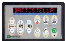
Панель управління Панель управления