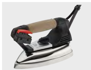
Парова праска EOS PRO (включена в комплектацию) Паровой утюг EOS PRO (включён в комплектацию)