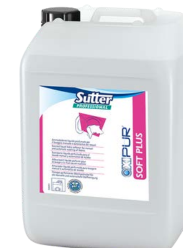
SOFT PLUS Професійний кондиціонер-нейтралізатор