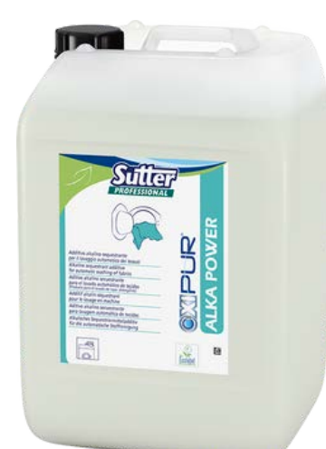
ALKA POWER Лужний засіб для попереднього та основного прання