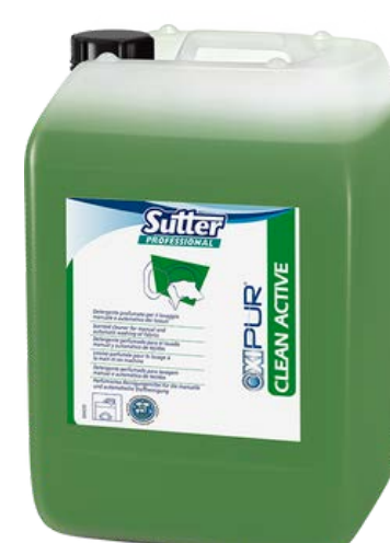
CLEAN ACTIVE Високо-концентрований підсилювач прання