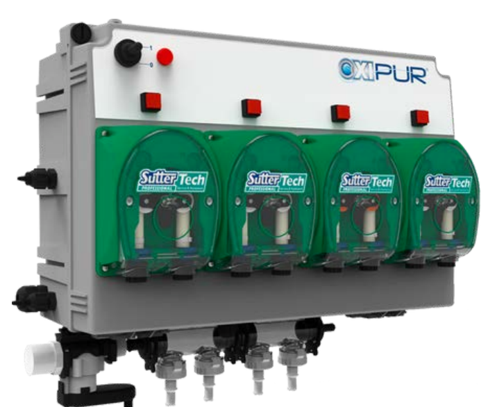
Система дозування рідких миючих засобів SMART · Дозування до 6 різних продуктів рідкої хімії · Використання до 20 професійних програм