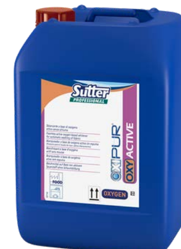
OXI ACTIVE Професійний кисневий відбілювач