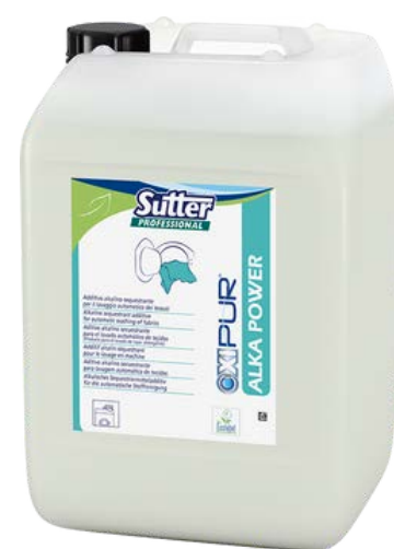
ALKA POWER Лужний засіб для попереднього та основного прання