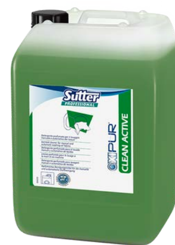
CLEAN ACTIVE Високо-концентрований підсилювач прання