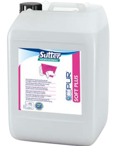
SOFT PLUS Професійний кондиціонер-нейтралізатор