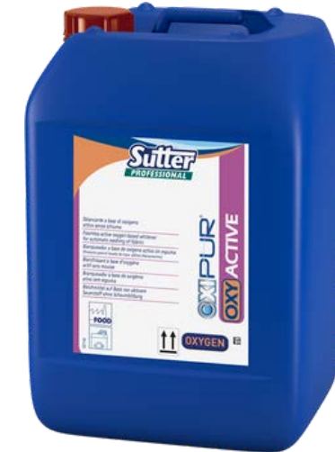
OXI ACTIVE Професійний кисневий відбілювач