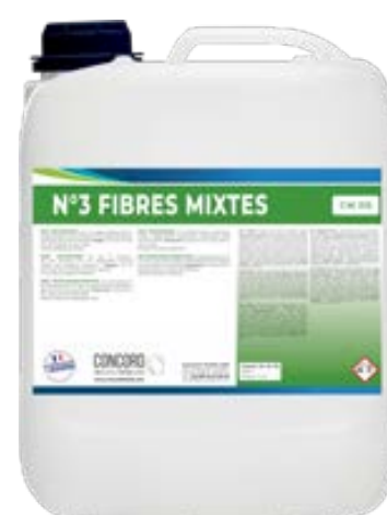
ALL-in-ONE Професійний ензиматичний засіб для аквачистки