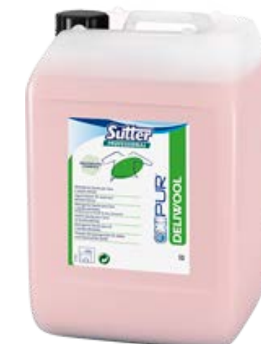
DELIWOOL Засіб для аквачистки вовни, шовку та інших делікатних тканин