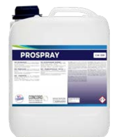
PROSPRAY Професійний засіб для попередньої обробки та видалення плям