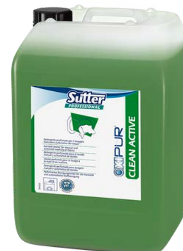
CLEAN ACTIVE Високо-концентрований засіб, з сильним проникаючим ефектом