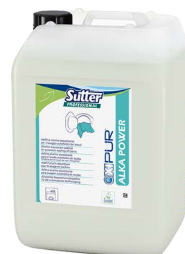
ALKA POWER Лужний засіб для попереднього та основного прання