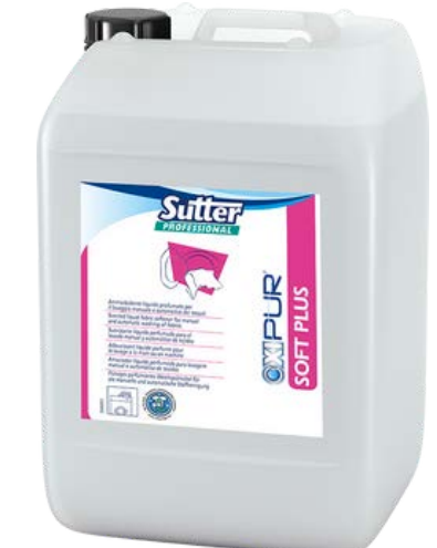
SOFT PLUS Професійний кондиціонер-нейтралізатор