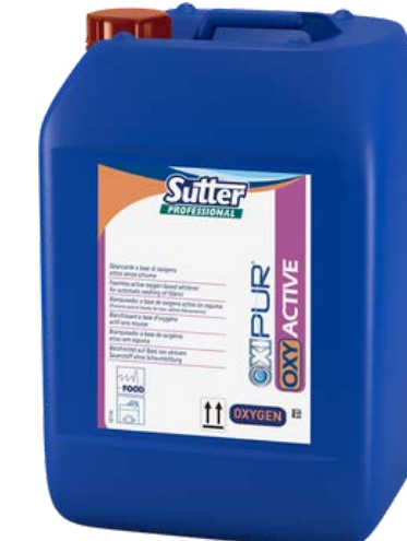
OXI ACTIVE Професійний кисневий відбілювач