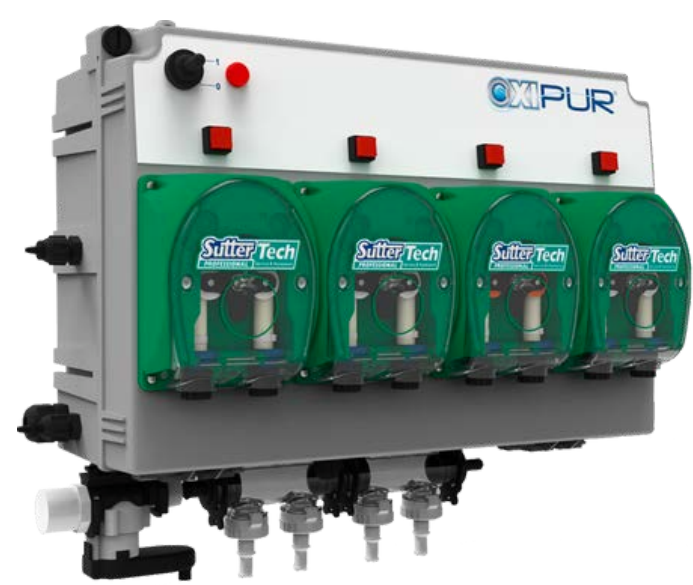
Система дозування рідких миючих засобів SMART · Дозування до 6 різних продуктів рідкої хімії · Використання до 20 професійних програм