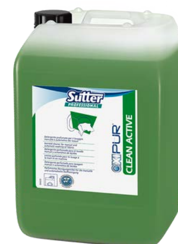
CLEAN ACTIVE Високо-концентрований підсилювач прання