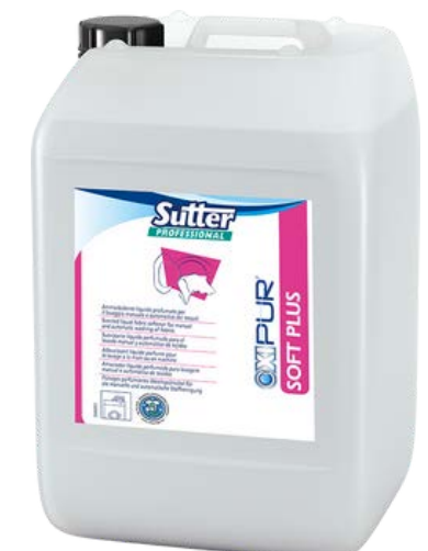
SOFT PLUS Професійний кондиціонер-нейтралізатор