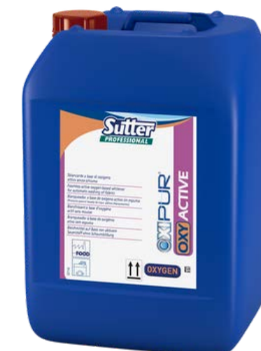
OXI ACTIVE Професійний кисневий відбілювач