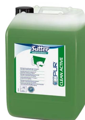
CLEAN ACTIVE Високо-концентрований підсилювач прання